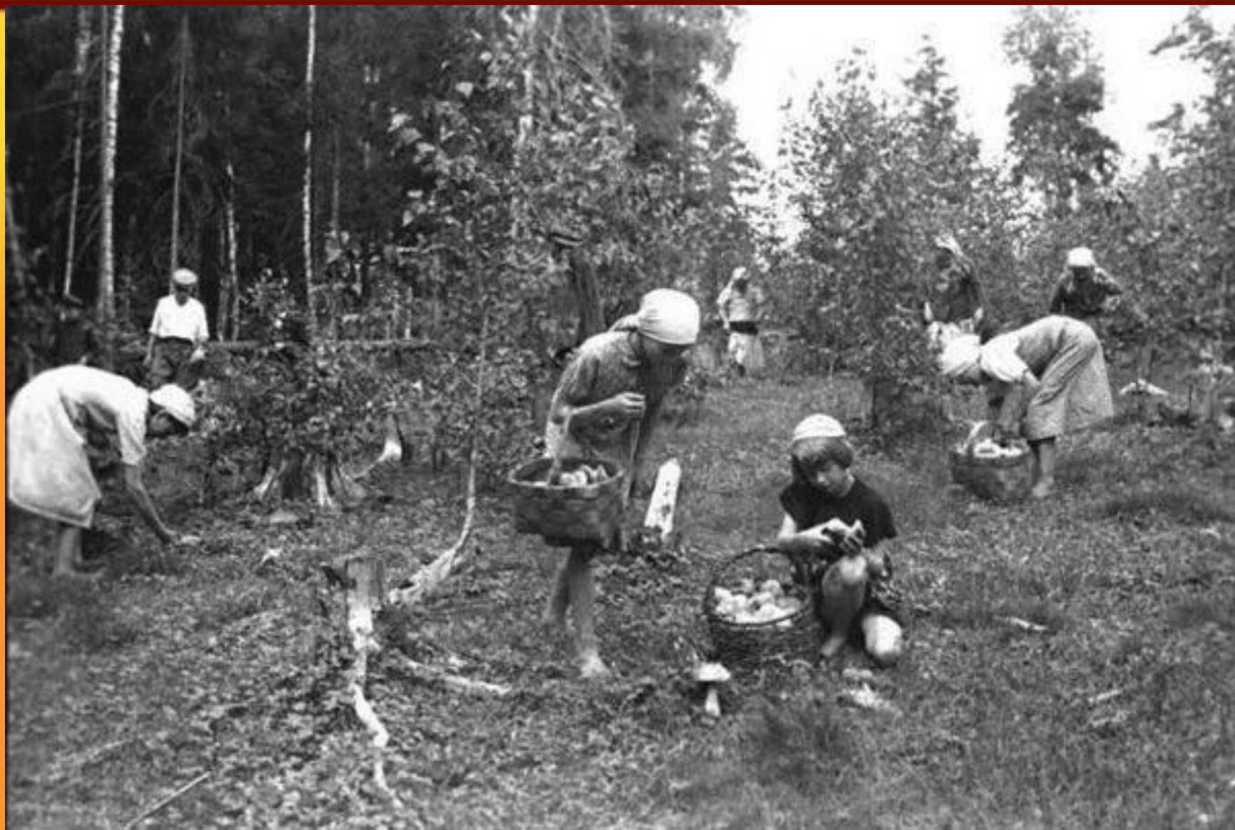
Собирали грибы и ягоды.