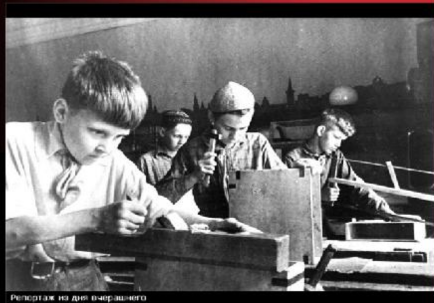
Репортаж на дню вчерашнего